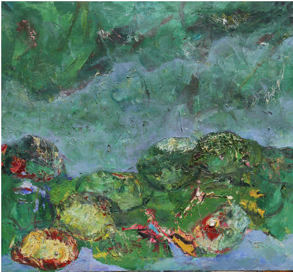
Chermet W/gebrirel Dual Artist: 2015